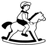
ГРАФИК ЗА ПРИЕМ И ПРЕДАВАНЕ НА ДЕЦАТА